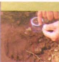
Naturschutz als Erlebnis: Wölfe zählen in den Karpaten, Bärenfahrten bestimmen in der slowakischen Tatra